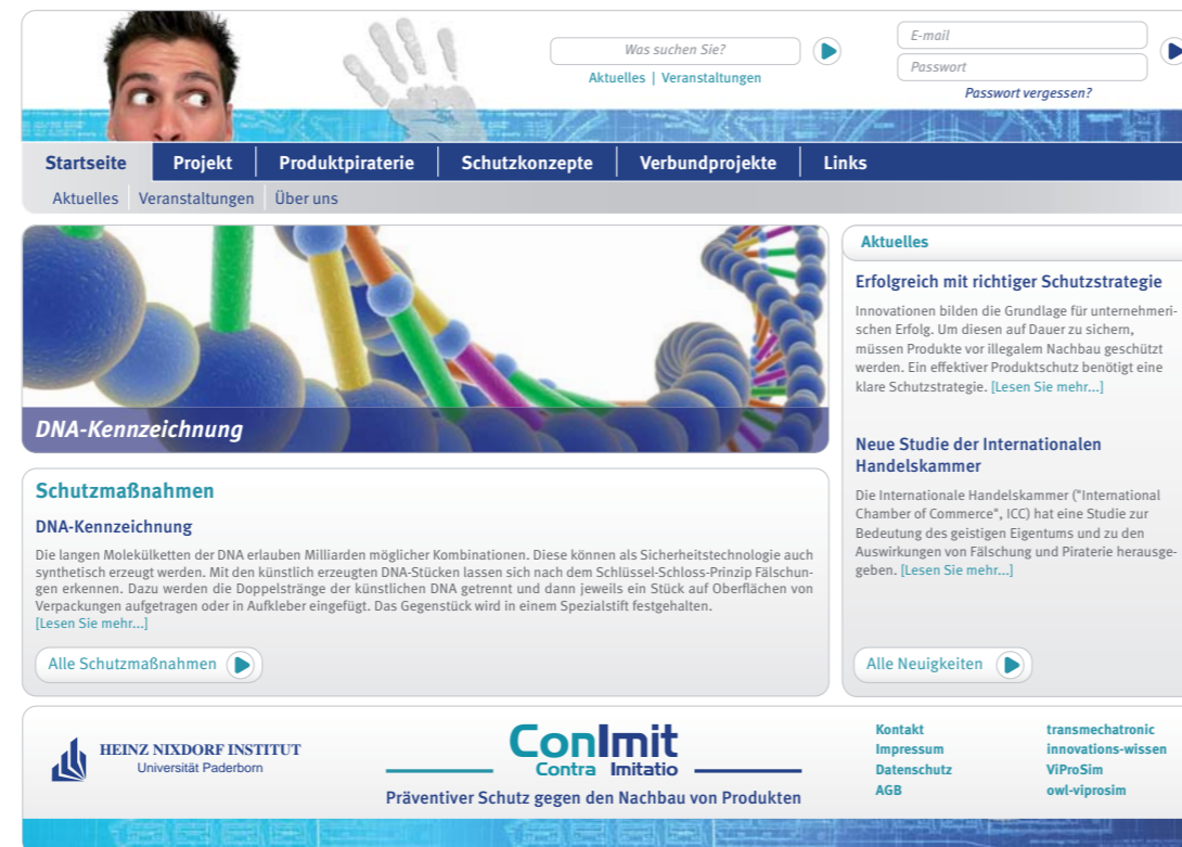
Startseite des Online-Portals www.Conlmit.de

Sie wollen Ihr Unternehmen vor Produktpiraterie schützen? Eine zentrale Anlaufstelle ist das Online-Portal Conlmit.de: Es bietet aktuelle Studien und Ratgeber, Veranstaltungsankündigungen, über 100 prägnant beschriebene Schutzmaßnahmen sowie Experten, die bei der Auswahl, Wirtschaftlichkeitsbetrachtung und Implementierung von Schutzmaßnahmen unterstützen können.