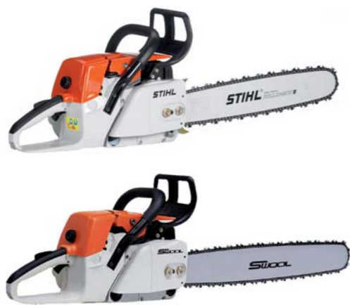
Original (oben) und Plagiat (unten) einer Motorsäge der Firma Stihl

Zum Schutz vor Produktpiraterie gibt es produkt- und prozessbezogene, IT-basierte, kennzeichnende und rechtliche Schutzmaßnahmen. Maßnahmen am Produkt wie der Einbau selbsterstörender Elemente erschweren das Reverse Engineering. Durch den Einsatz additiver Fertigungsverfahren im Produktionsprozess können schwer kopierbare Bauteilgeometrien und -eigenschaften hergestellt werden. IT-basierte Maßnahmen verhindern z. B. den unberechtigten Zugriff auf Daten. Kennzeichnende Maßnahmen ermöglichen die Beweisführung im Schadensfall und geben Orientierung im Kaufprozess. Schutzrechte können als Marken, Patente und Geschmacks- bzw. Gebrauchsmuster angemeldet werden. Aus der Fülle der Möglichkeiten sind die für die spezifische Bedrohungssituation geeigneten zu identifizieren.